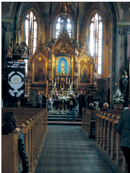
Fot. 1. Wnętrze swarzewskiego kościoła parafialnego z widokiem na ołtarz główny