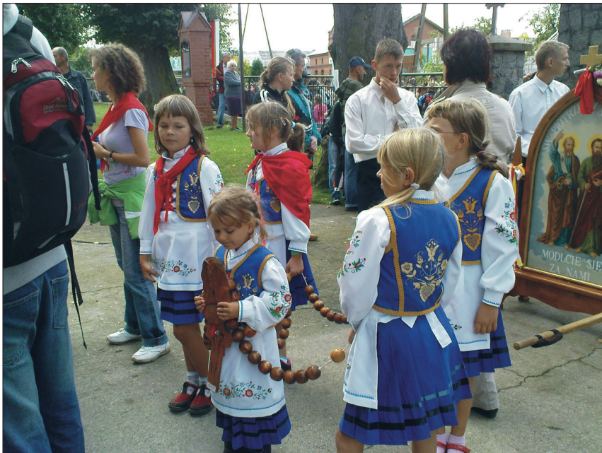
Fot. 5. Dzieci w strojach kaszubskich podczas uroczystości odpustowych w Swarzewie