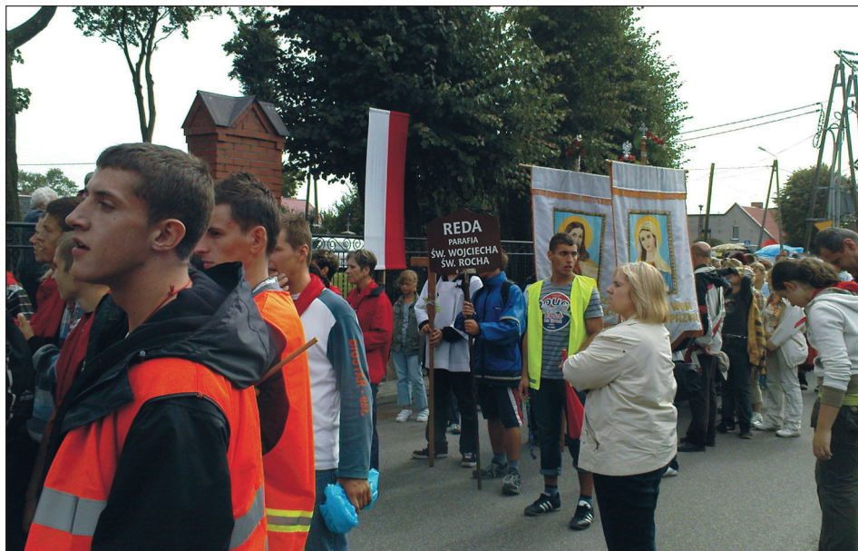
Fot. 3. Młodzież oazowa udająca się na uroczystości odpustowe Narodzenia Najświętszej Marii Panny w Swarzewie 5 września 2009 r.