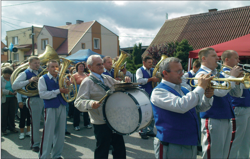
Fot. 4. Orkiestra dęta towarzysząca pielgrzymce na uroczystość odpustową Narodzenia Najświętszej Marii Panny w Swarzewie 5 września 2009 r.