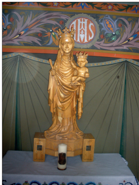
Fot. 2. Figura Matki Boskiej Swarzewskiej z Dzieciątkiem w kościele parafialnym w Swarzewie